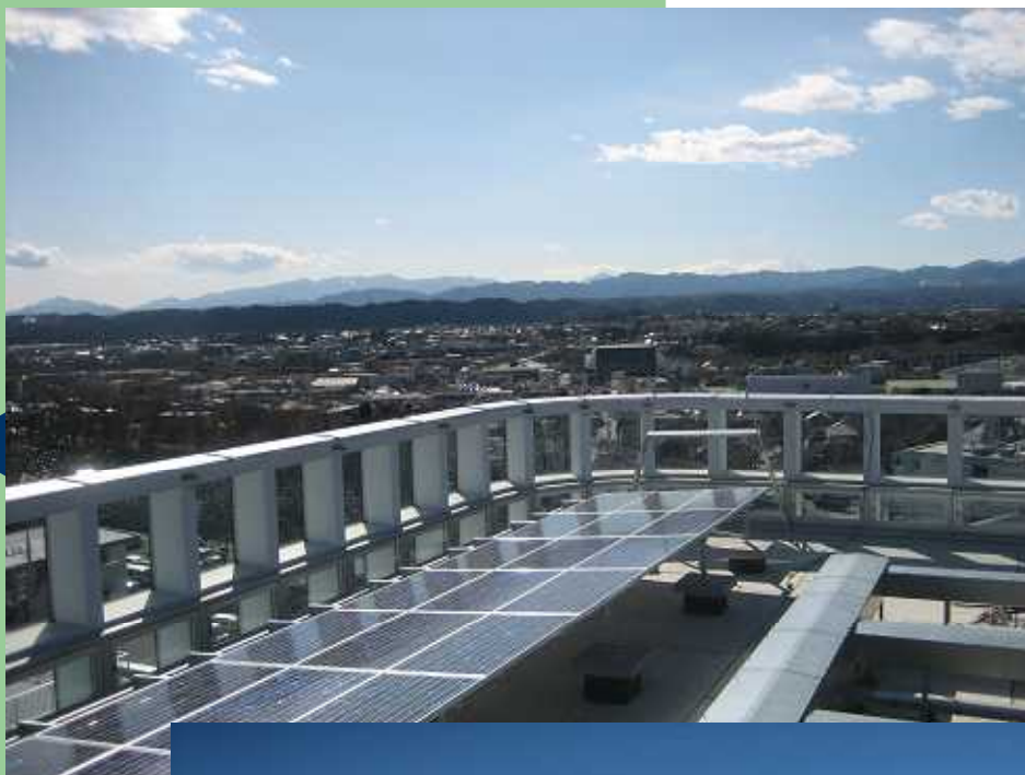
市役所からみるまちの景色